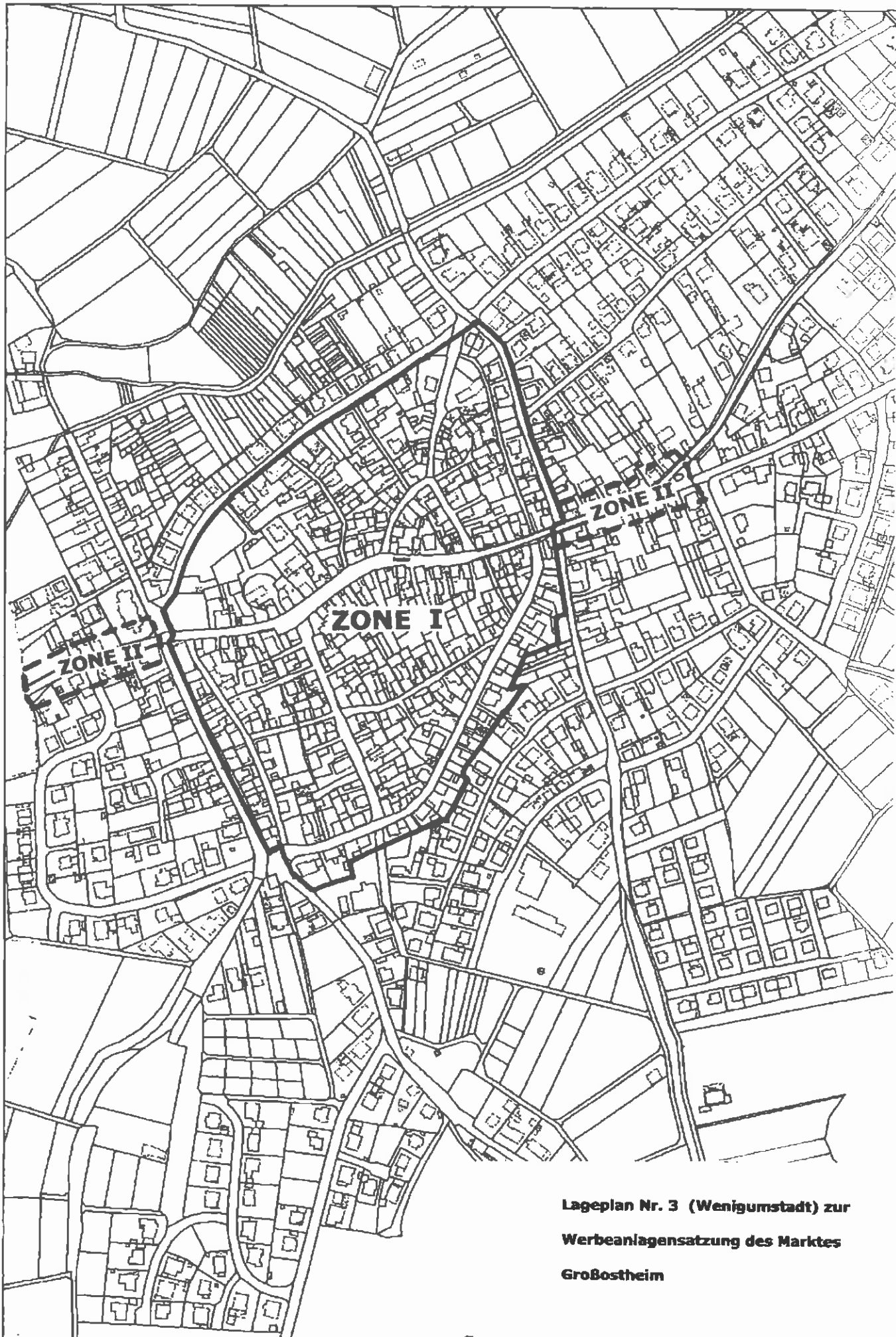
Lageplan Nr. 3 (Wenigumstadt) zur Werbeanlagensatzung des Marktes Großostheim