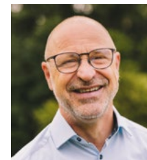
Roland Schuler Zweiter Bürgermeister Markt Großostheim