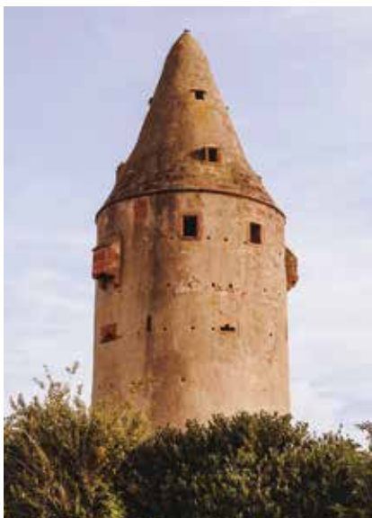
Wartturm – Wahrzeichen der Gemeinde Schaafheim, 1492 erbaut und 22 Meter hoch