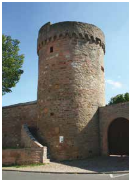
Stumpfer Turm in Großostheim – ehemaliger Pulverturm

Alle Termine und aktuelle Informationen zum Führungsangebot finden Sie im Internet unter: www.grossostheim.de